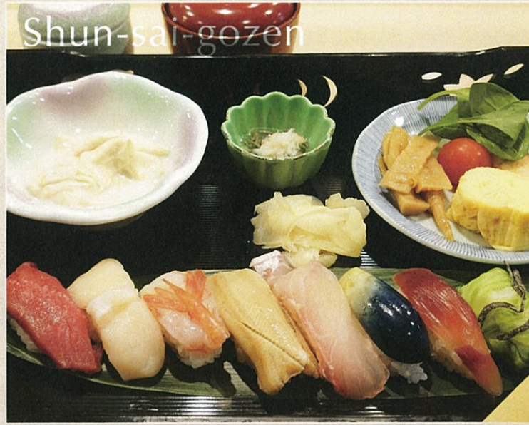
旬彩御膳 1,850円 (握り8点、茶碗蒸し、小鉢、酢の物付)