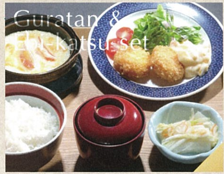
グラタンとエビカツセット 1,320円