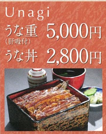
Unagi うな重 5,000円 (肝吸付) うな丼 2,800円