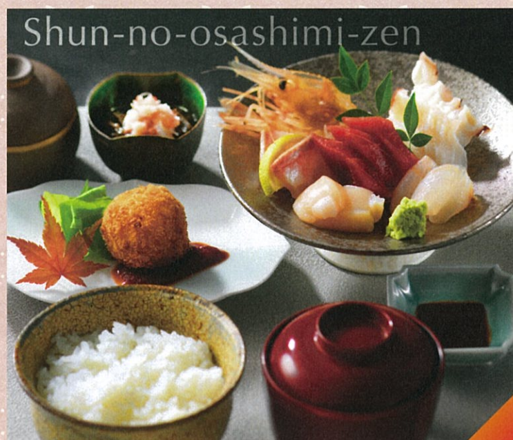
旬のお刺身膳 1,430円 (お刺身5点盛り、茶碗蒸し、酢の物付)